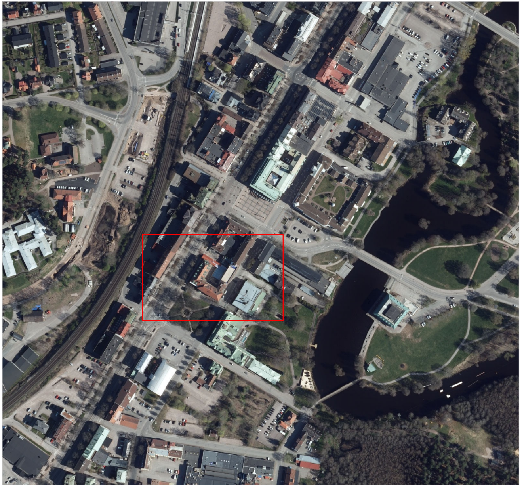
ÖVERSIKTSKARTA Skala 1:5 000 (A2)

Koordinatsystem i plan: SWEREF99 15 00 Koordinatsystem i höjd: RH2000